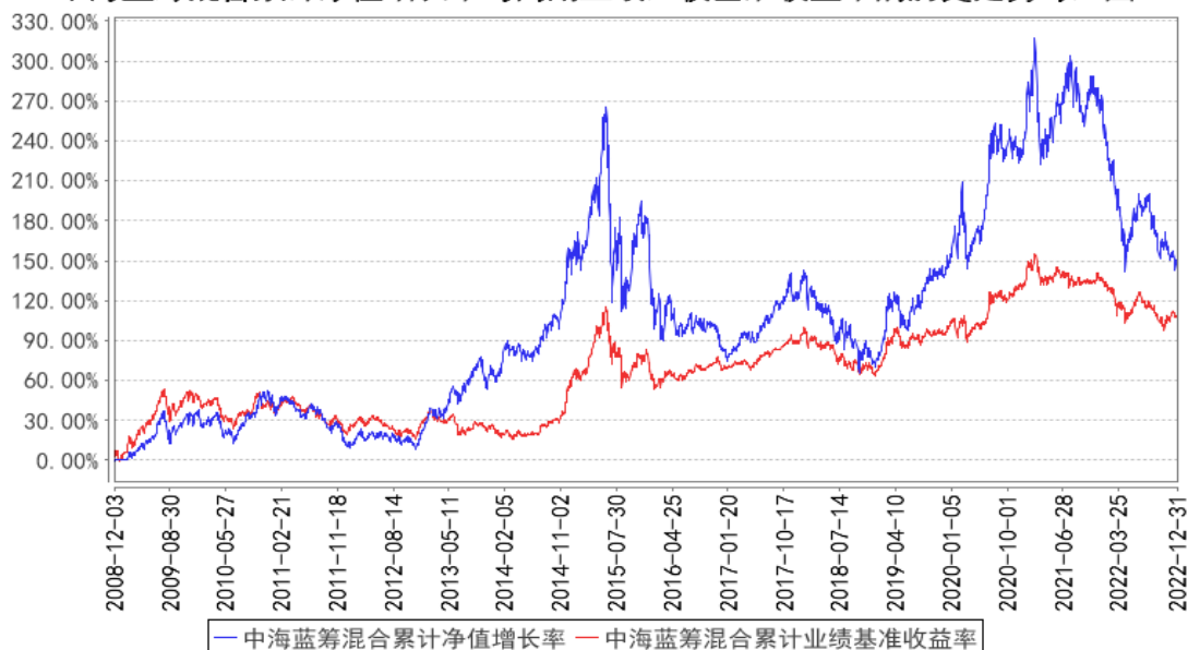
中海蓝筹混合累计净值增长率与同期业绩比较基准收益率的历史走势对比图